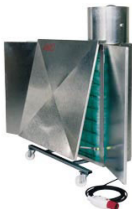
COLOUR JET 1 (2)

S přídatným předfiltrem pro mokré aerosoly