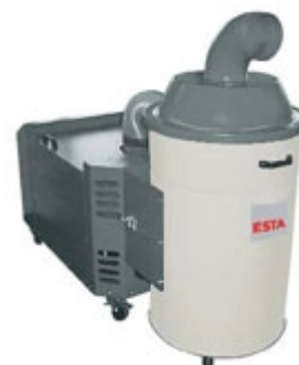
DUSTOMAT 160 S