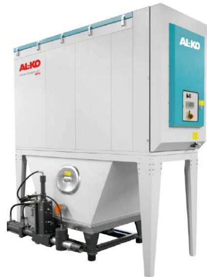
MOBIL POWER JET 300 BP

Možnost vybavit zařízení automatickým systémem pro rozpoznání zapnutých strojů a integrovaným kompresorem. Rovněž tak přidavným tlumičem hluku a dále pak šnekovým ústrojím briketovacího lisu.