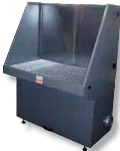
Odsávací stůl ESTA AV