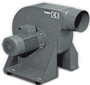
Obr.1 Ventilátor ESTA RG 200 dodá potřebný odsávací výkon